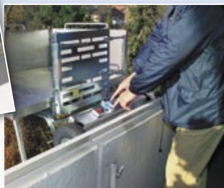
Bedienung am Kopfstück (Modell MV)