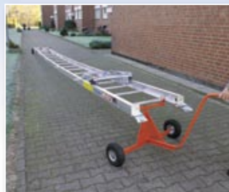
leichter Transport auch in montiertem Zustand mittels Transporthilfe