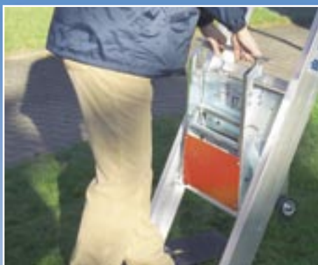
Einhängen des Antriebs von vorne